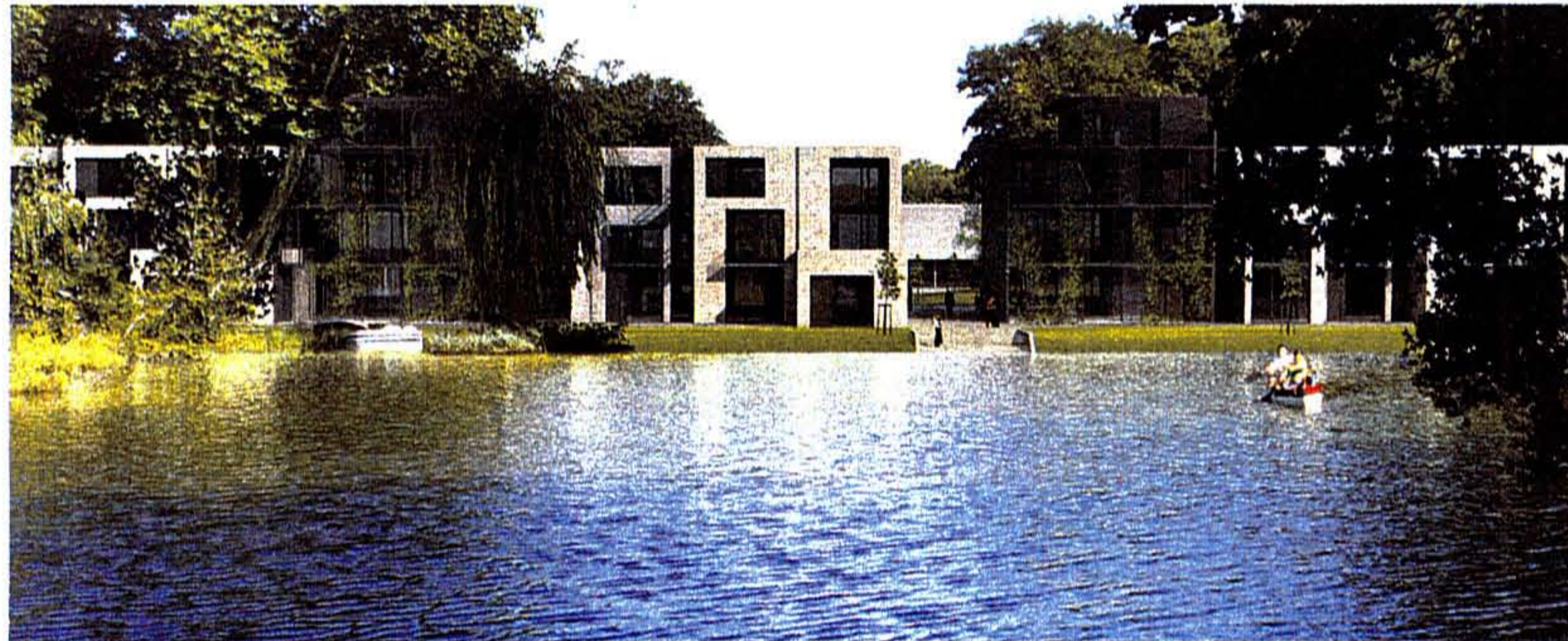
Der Zugang zum See im Zentrum der Wohnanlage ist den Anwohnern vorbehalten

Der Zugang zum Ufer des künstlichen Gewässers soll, wie etwa am Wald- oder am Dianasee, ausschließlich den Anwohnern vorbehalten sein. Der exklusive Seezugang hat allerdings seinen Preis. „3000 bis 4500 Euro pro Quadratmeter“, so Stoffel. Das sei kein Wohnen im Luxusbereich, sondern gehobene Mittelklasse. Den Entwurf für die Häuser hat das Berliner Archi-