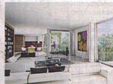
Flexible Grundrisse gehören zum Grundkonzept