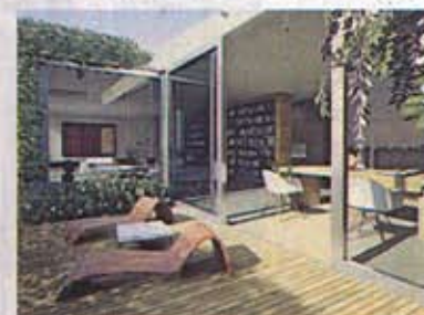
Zu jeder Wohneinheit gehören Privatgärten oder großzügige Terrassen