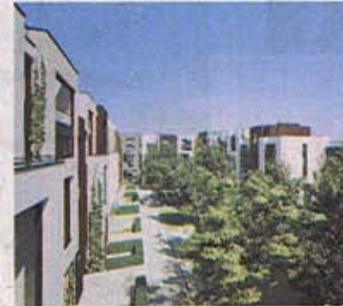
Die Häuser gruppieren sich um einen 3000 Quadratmeter großen Hofgarten

Auf einem 90 000 Quadratmeter großen Naturgrundstück am Griebnitzsee zwischen Berlin und Potsdam wollen die beiden 46 Einzelhäuser bauen. Das vierte Projekt schließlich soll wieder mitten in der Stadt entstehen: „Ein 50 Meter ho-